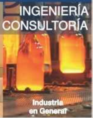
INGENIERÍA Y CONSULTORÍA